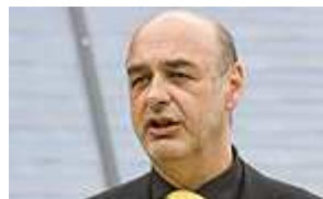
Landesrat Manfred Wegscheider