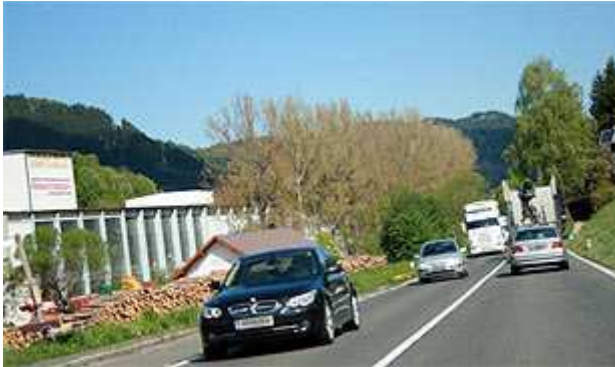
Die Asfinag hat sich für die Variante über den Perchauer Sattel entschieden.

Es ist entschieden: Der Neumarkter Sattel kommt für den vierspurigen Ausbau nicht mehr in Frage. Die künftige S 37 wird über den Perchauer Sattel gebaut. Dies teilte Asfinag gestern mit.